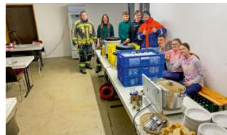
Die Jugendgruppe der Feuerwehr Weißdorf sorgte für die Verpflegung der Besucher des Christbaumfeuers an der Hasenheide.

31.03.2024 – Verkehrsunfall zwischen Benk und Kirchenlamitz