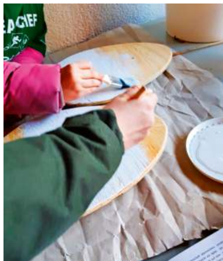
Gemeinsam mit den Hortkindern wurden die Holzeier bunt angemalt.