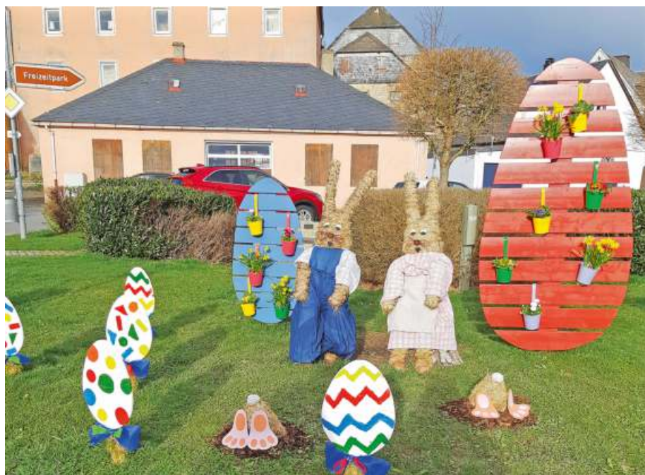
Ein farbenfroher und fröhlicher Blickfang in der Osterzeit: Die bemalten Holzeier der Hortkinder.