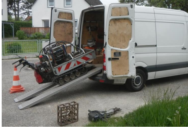
Be- und Entladen des Fahrzeugs