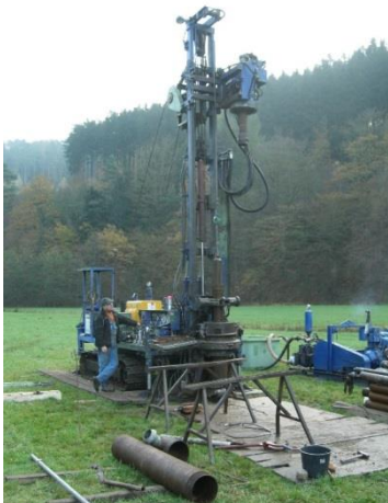
Kernbohrgerät auf Kettenfahrwerk