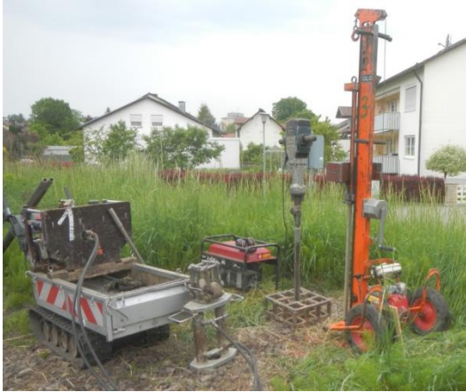
Transporttraupe mit Hydraulikaggregat für hydraulisches Ziehgerät, Stromaggregat, Elektrohammer, Lindenmeyer Rammsondiergerät